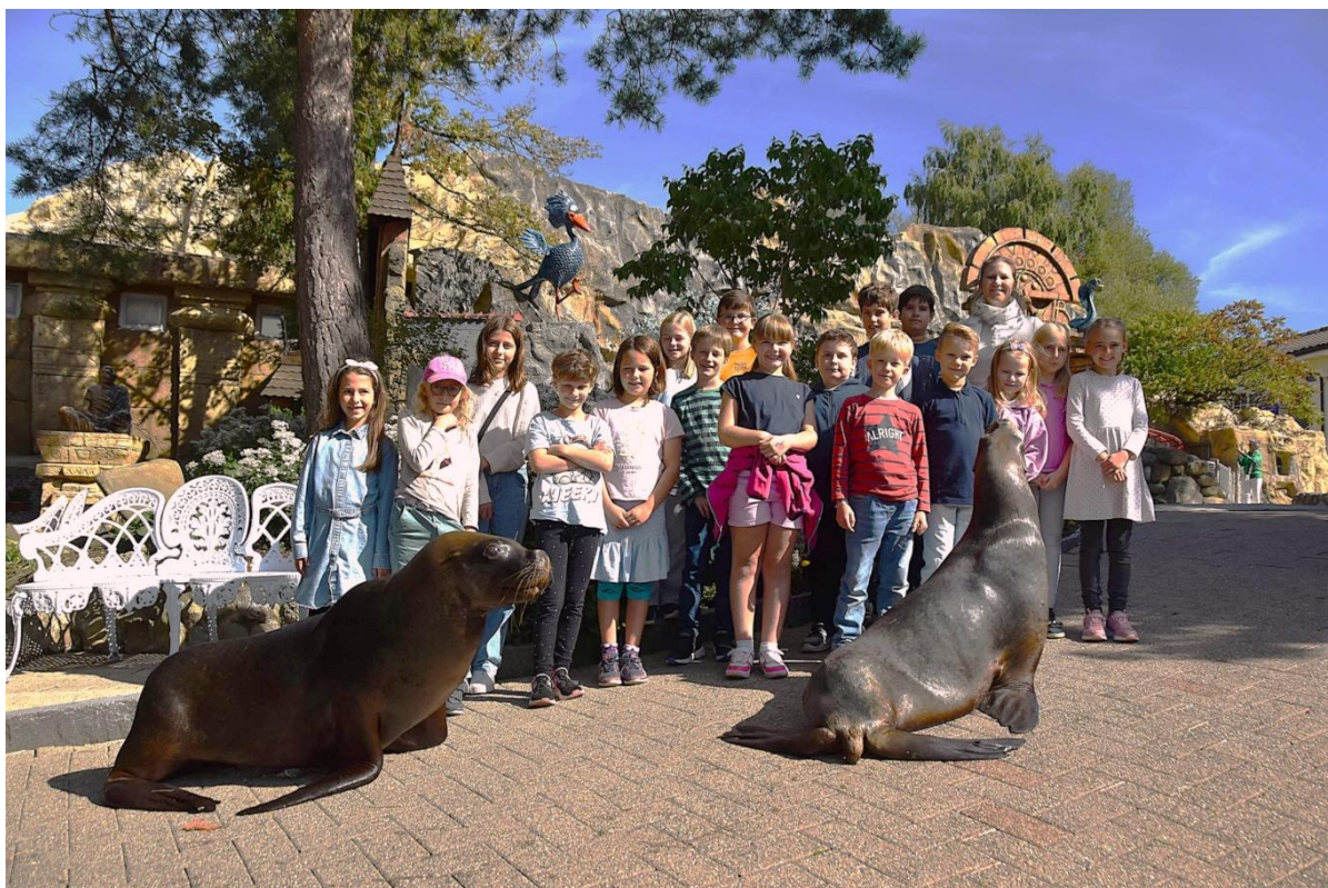
Jedes Kind erhielt ein Erinnerungsfoto nach dem schönen Anlass.